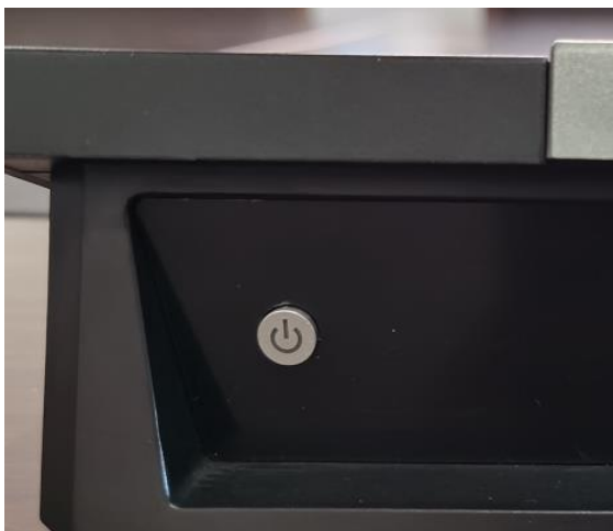
背面打开开关按钮