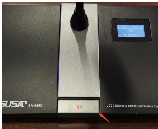
发言时按一下发言按钮