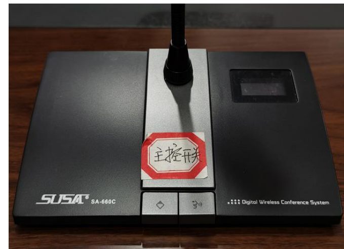
主话筒 可关闭其他正在发言话筒