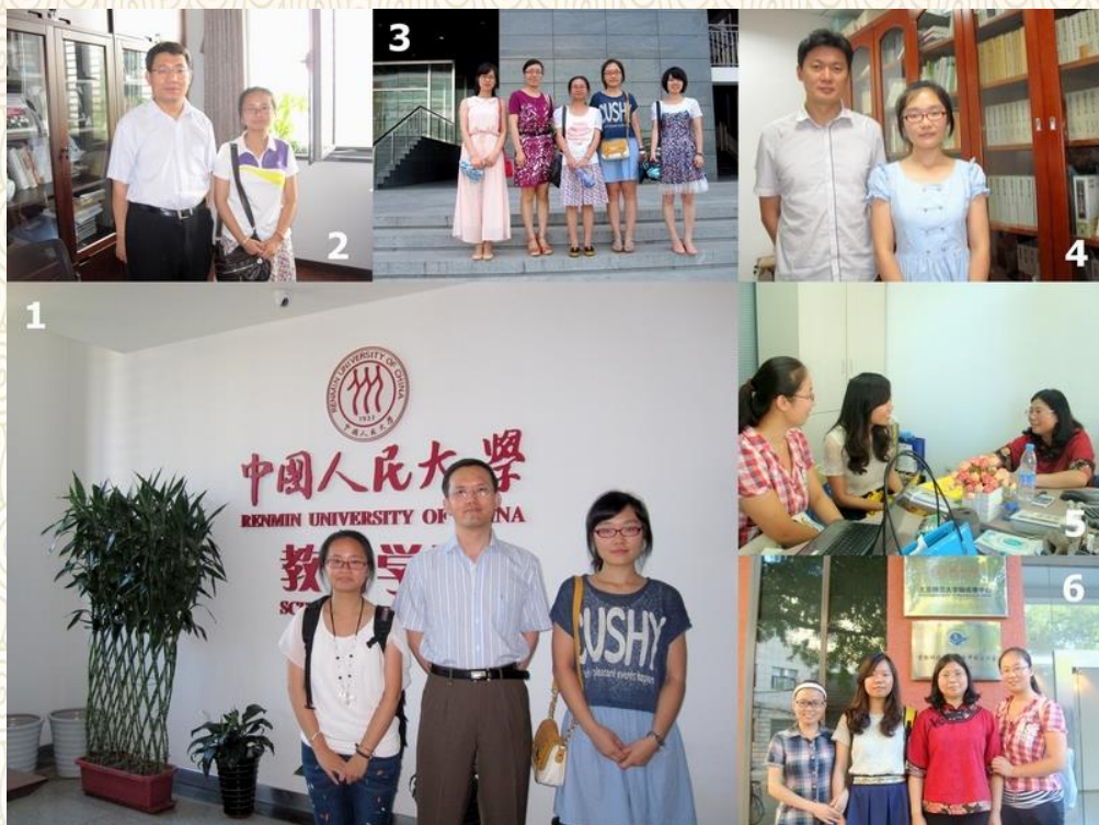
国际化教育资源平台： 对话在京多所高校关心教育国际化的学者