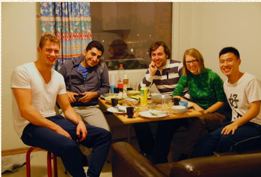
挪威-奥斯陆-我和室友

到达奥斯陆后的第一个周五，与室友们聚餐，从这里开始了一场不同国家、不同成长经历、不同文化习俗和礼仪、不同生活习惯和不同思维方式的碰撞。