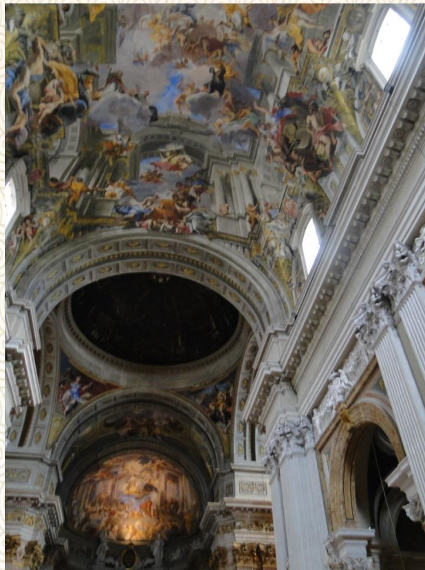
意大利-大教堂里逼真的立体壁画