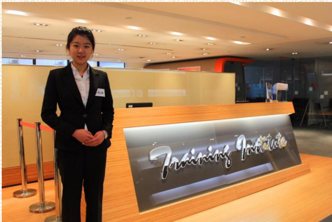
访问 FWD 公司