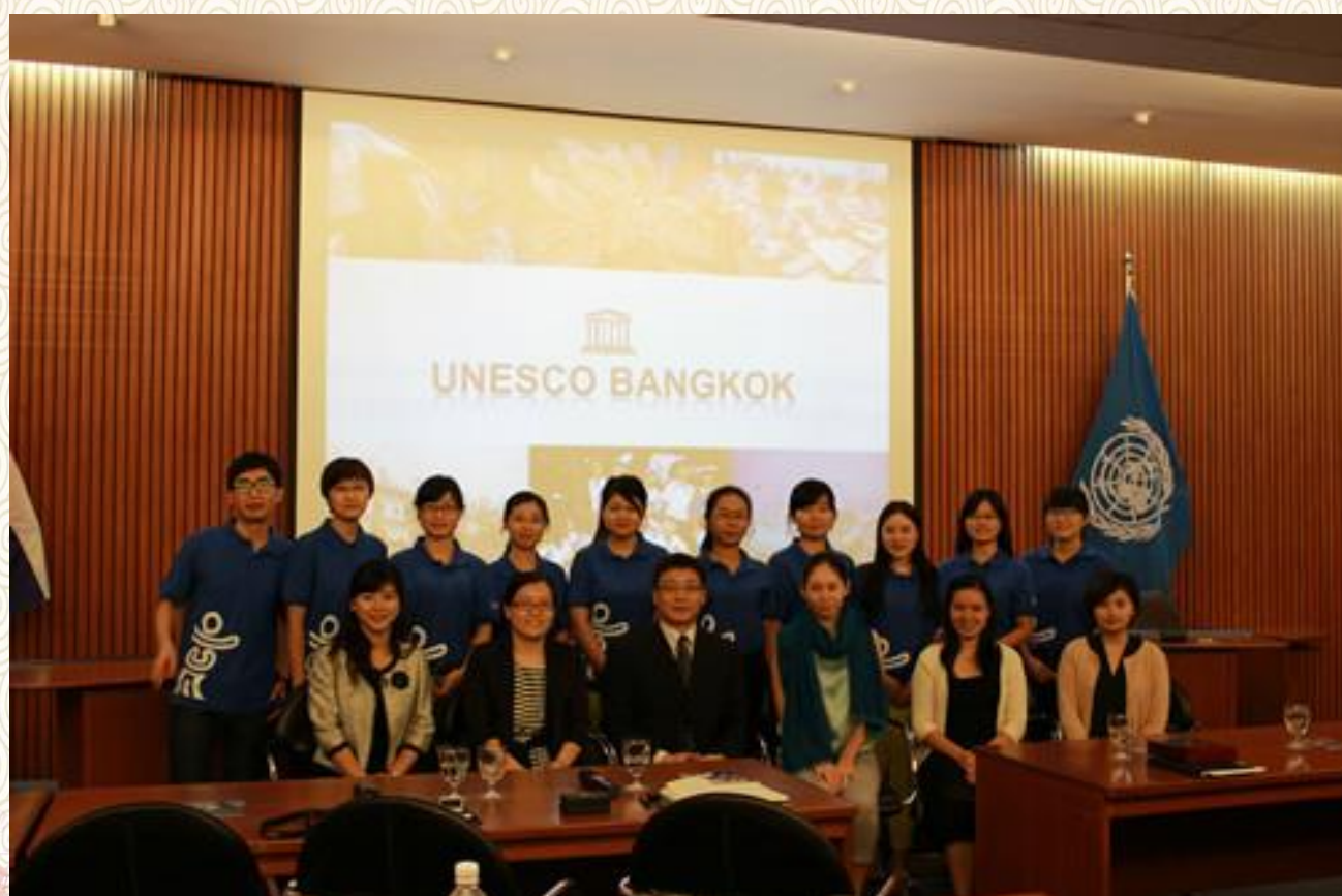
访问 UNESCO 亚太教育局