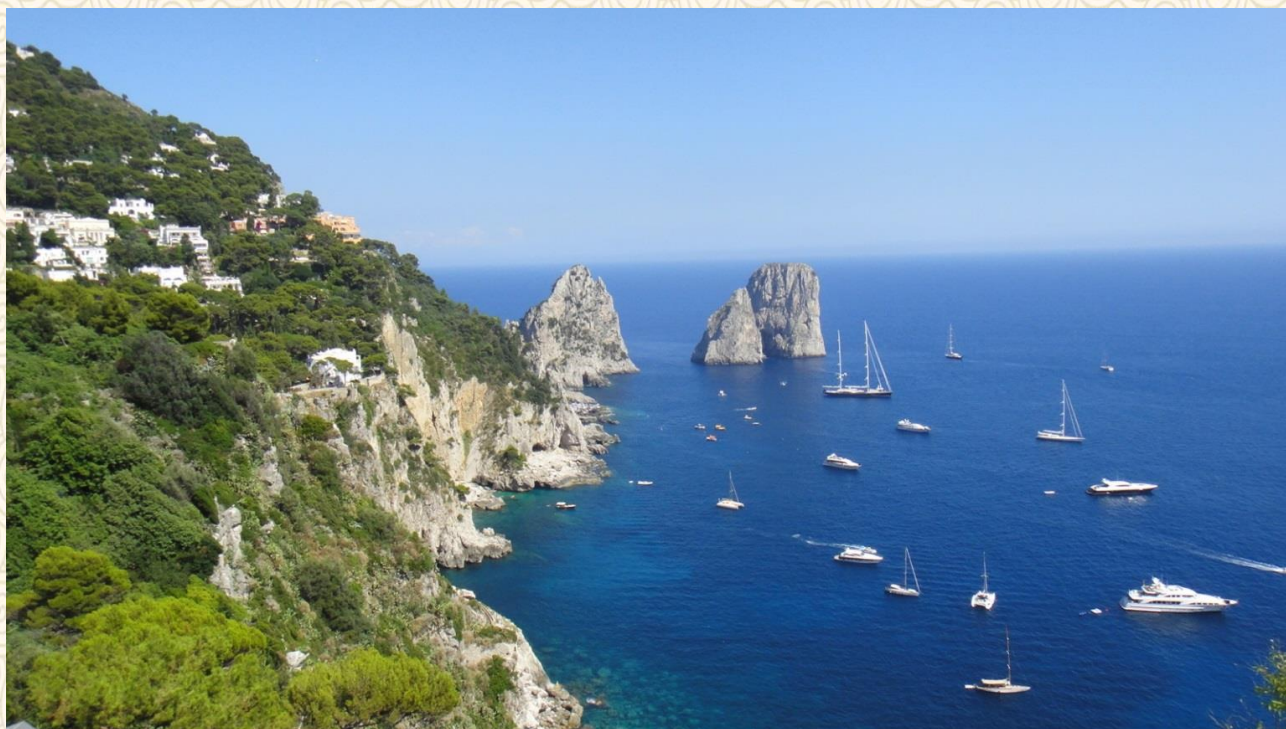
意大利-海在仙境中的卡普里岛