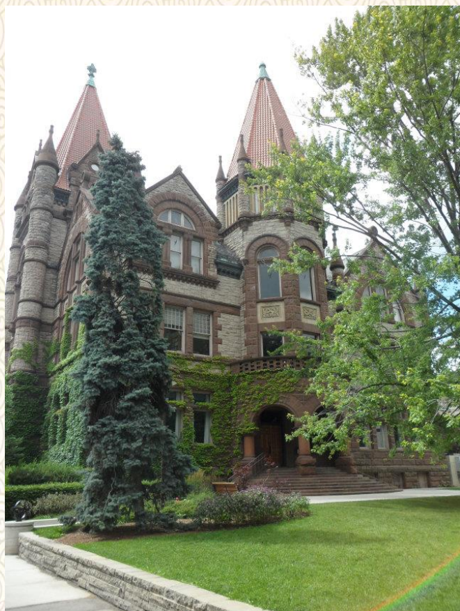
加拿大多伦多大学