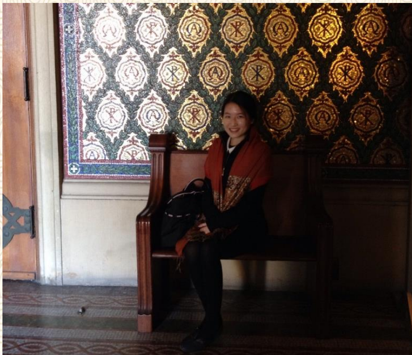
在斯坦福大学纪念教堂

不管是它成立的缘由，还是它别具一格的圣殿般的校园，一切的一切，都充满着传奇的故事，这样一个有着历史温情传说的校园，怎能不让人心中温暖？