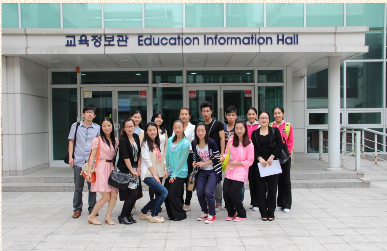
首尔国立大学游学之旅

教育学院韩国游学项目团队开展了为期数天的科研与文化交流。无论是本科专业学习、韩国升学入学考试制度等教育学科话题，抑或体育教育系专业、课程设置等体育学科话题，我们都与韩国友人进行了深入的探讨和交流。我们的民族传统武术节目和文艺节目，韩国学生的祭祀武术的十八技，交相辉映，渗透着中韩文化同根同源但各具特色的文化意蕴。