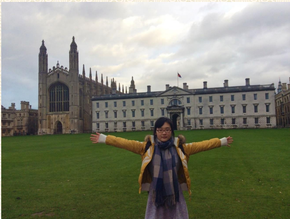
Hello, I am in King's College in University of Cambridge

英国之行，真的让人毕生难忘——在剑桥大学国王学院开怀畅想；仰望举世闻名的大本钟，透过伦敦眼瞭望天空，放眼世界……在那里，不仅可以感受到古典名校悠悠的文化气息，还可以领略许许多多世界著名的建筑，渗透着英国独有的古典与现代交织的气质。