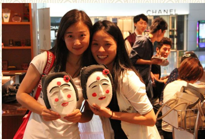
体验韩国传统手工艺制作