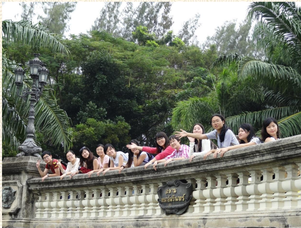
在易三仓大学的长廊上向你招手

泰国之行，让人印象最为深刻的是朱拉隆功大学教育学院的图书馆。图书馆内设备先进，设施齐全，最喜爱那图书馆内的座椅——按照人体工程学原理设计，坐起来十分舒适，并且还放在明亮的落地窗旁边。可以想象捧一本发黄的原文书，坐在舒适的椅子上，在冬日的午后一边晒太阳，一边品味经典，那是怎样的享受啊！