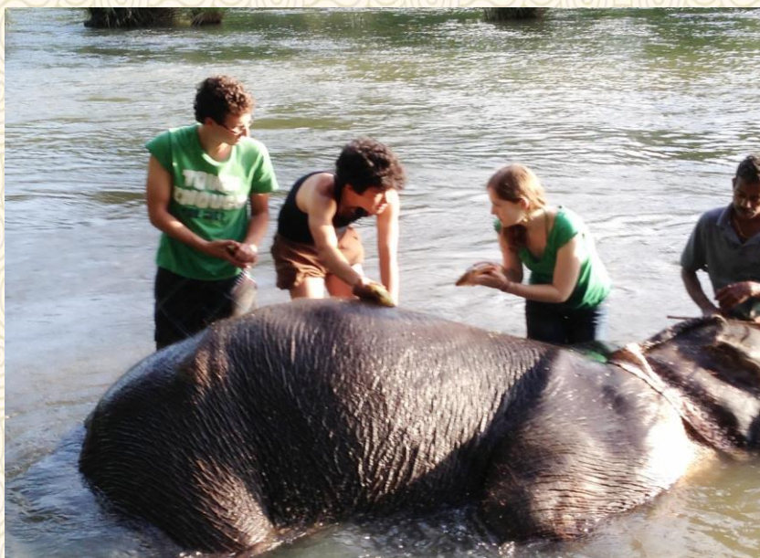
和两个德国少年一起在斯里兰卡大象孤儿院