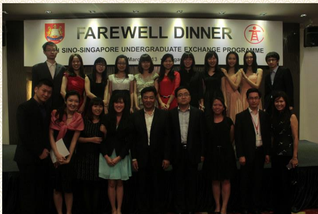
告别晚宴：浙江大学代表团与新加坡教育部的官员们