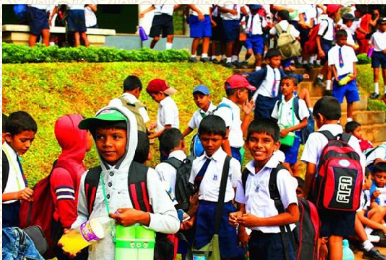
斯里兰卡的孩子们放学啦

每次回忆起过去的点点滴滴，有快乐，有感动，有心酸，有心痛，在心里暗暗地告诉自己：斯里兰卡，我一定会再去一次的。这个时候我才明白，人生的冷暖或许取决于每个人心灵的温度。