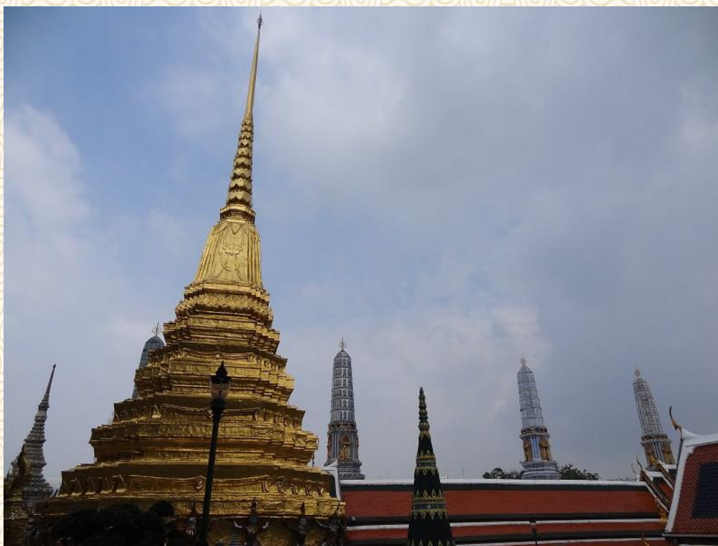
泰国曼谷美丽的尖顶建筑