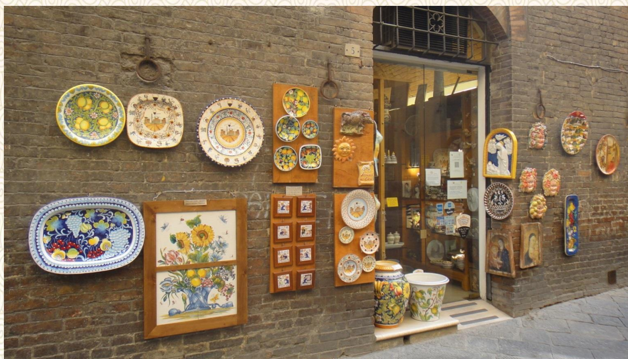
意大利-锡耶纳-艺术品是街道的灿烂

如何利用国内外资源和平台助力游学？面对众多的交流项目如何抉择？进行选择时是否需要考虑自己的专业背景？你的身边有很多待你开发的资源，请不要，将自己封锁在专业的领域之内。教育的问题非教育一家能解，社会更是一盘跨领域、多学科的沙拉。把握国内外机遇，开阔认知问题的视野，在游学中思考，在游历中学习！