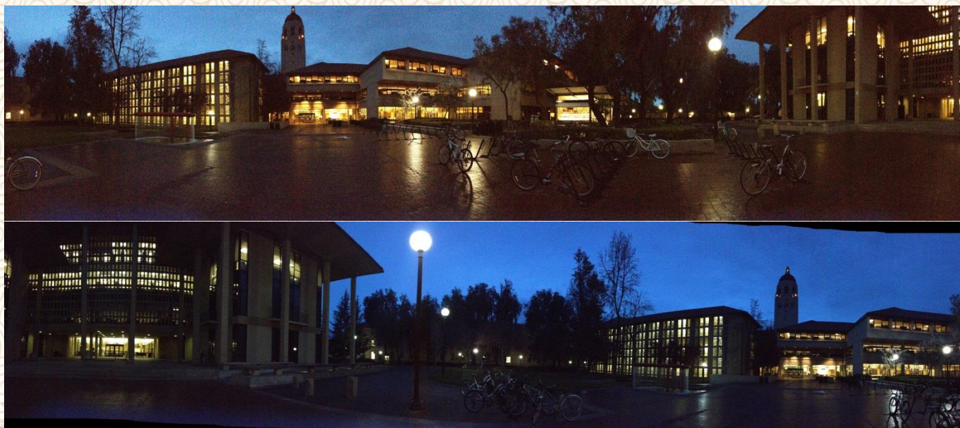
斯坦福早上 5 点的胡夫塔和藏书楼