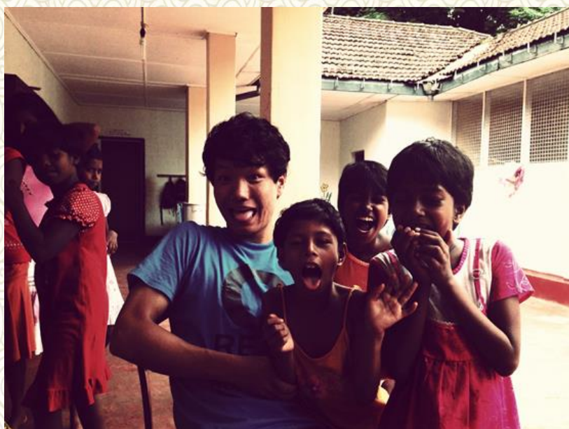
和孩子们一起呐喊吐舌