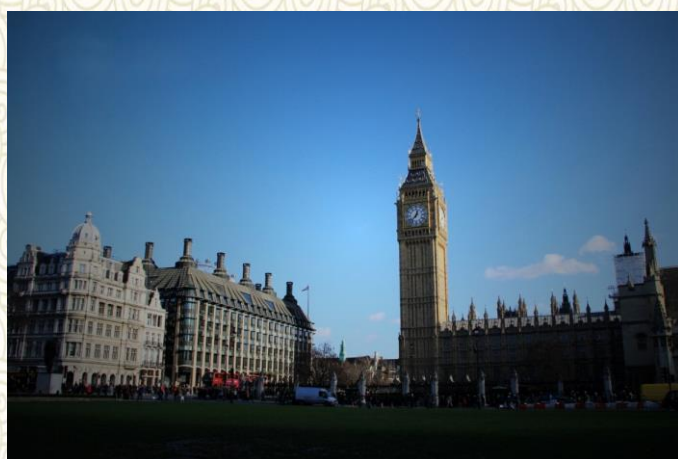
世界著名的 Big Ben