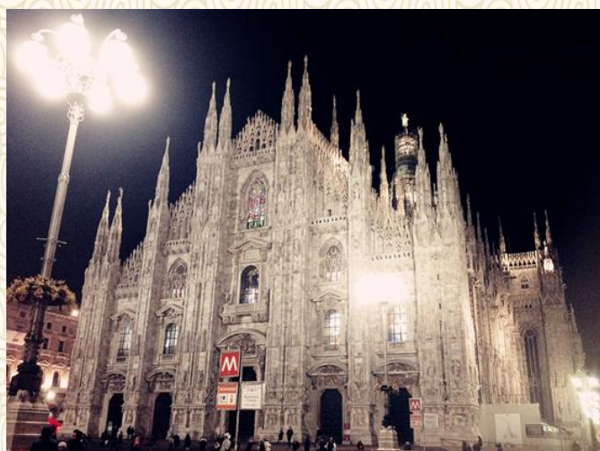
意大利-米兰大教堂的歌德式艺术