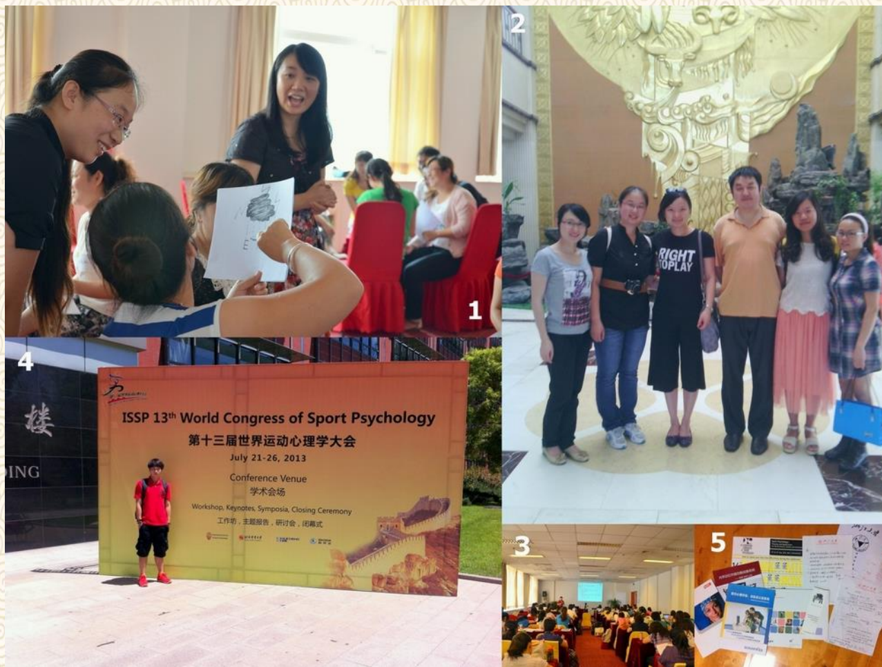
学科理论与实践探索：在京高校参与国际学术会议、体验教师培训项目