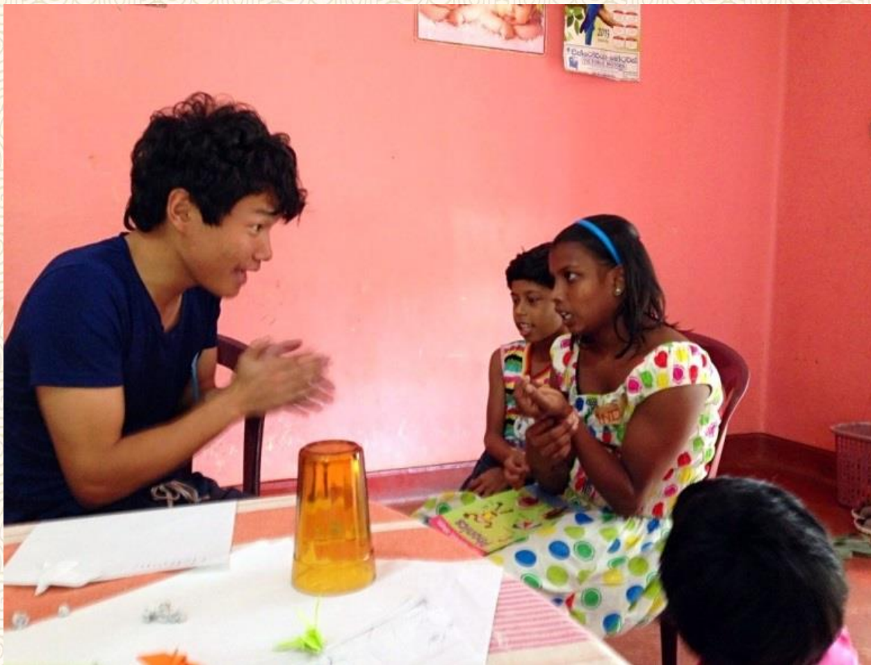
支教课堂——和孤儿院儿童一起做游戏

在 KANDY、在斯里兰卡、在整个东南亚、在全世界有很多不同类型的孤儿院。渴望将最好的祝愿给哪里的孩子们；渴望用点滴行动帮助他们，哪怕是一点点；渴望更多的志愿者们能将这份爱传递下去……相信：只要志愿者精神在，爱就会传递到世界每一个角落。