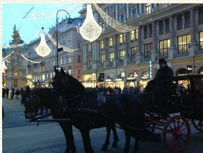
奥地利-“音乐之都”维也纳