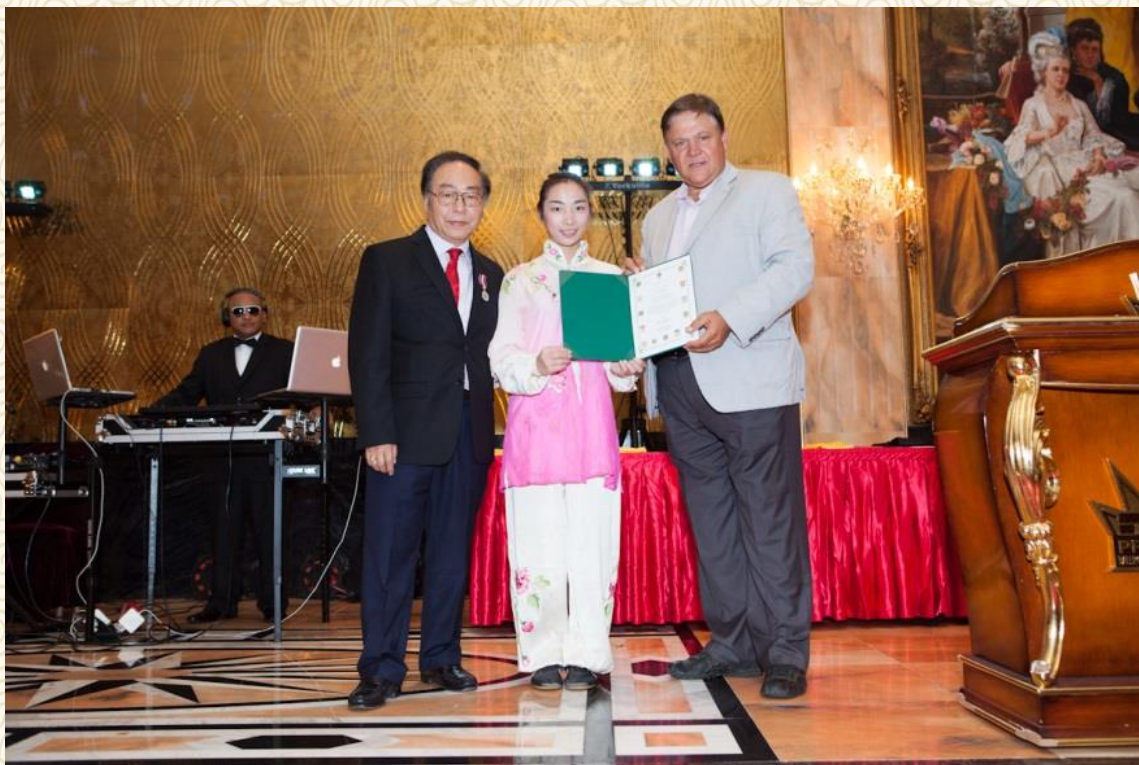
获得加拿大政府的表彰