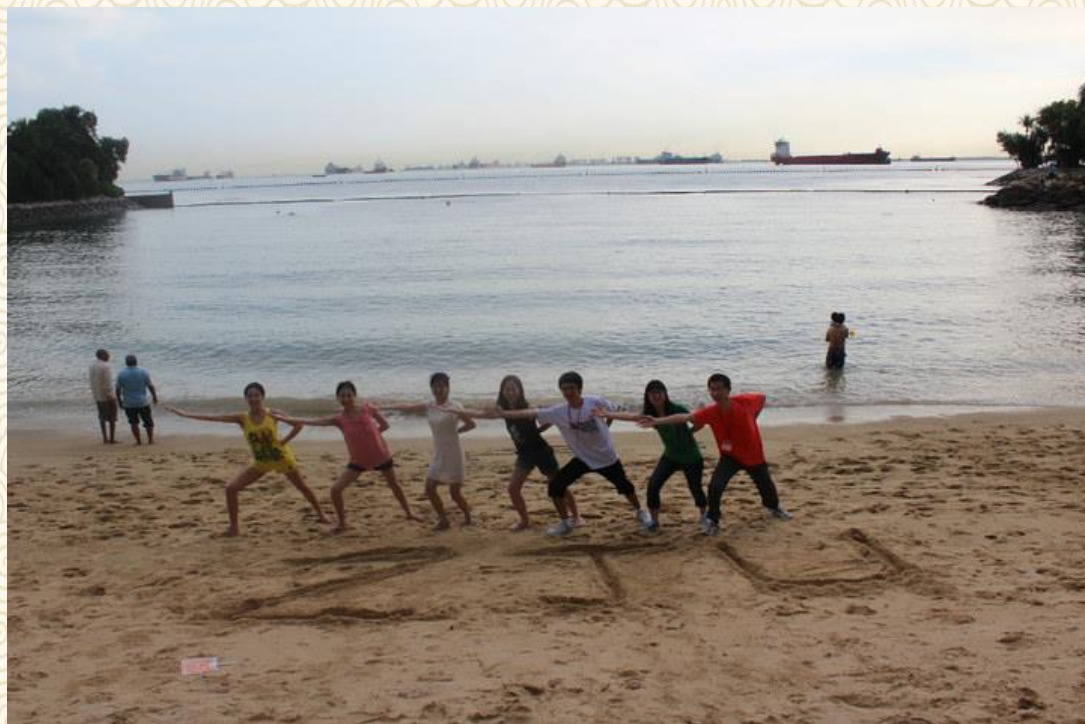
在新加坡圣淘沙的沙滩上写上大大的“ZJU”