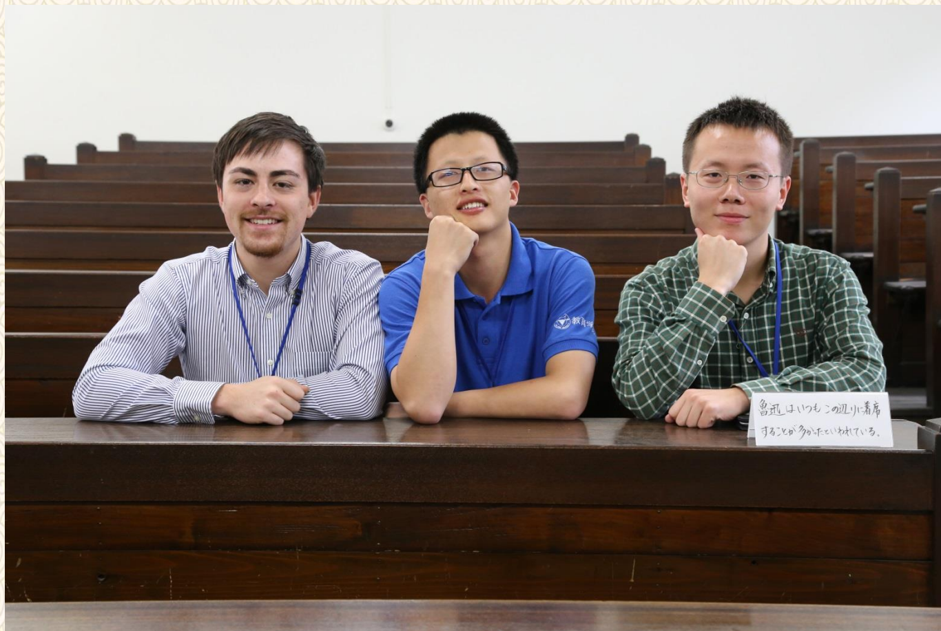
日本仙台大学——鲁迅旧桌