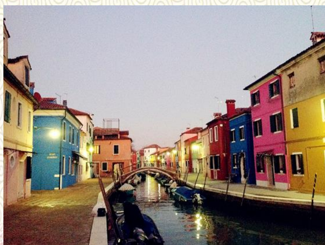
意大利-色彩缤纷的威尼斯