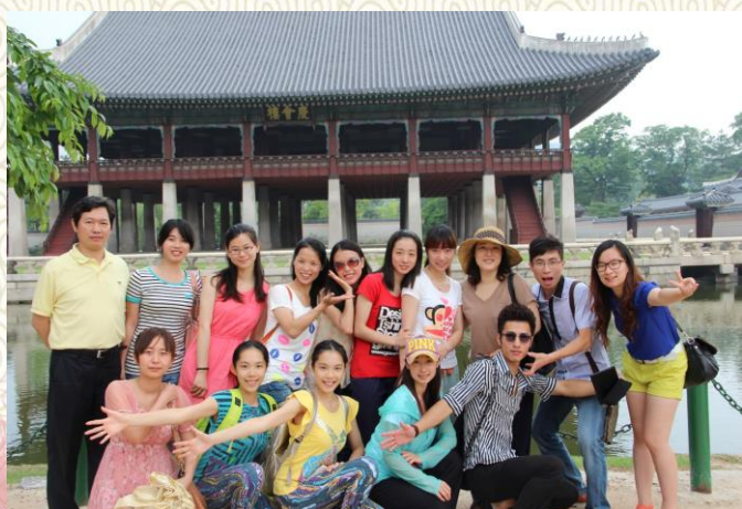
身在韩国景福宫，向你问好