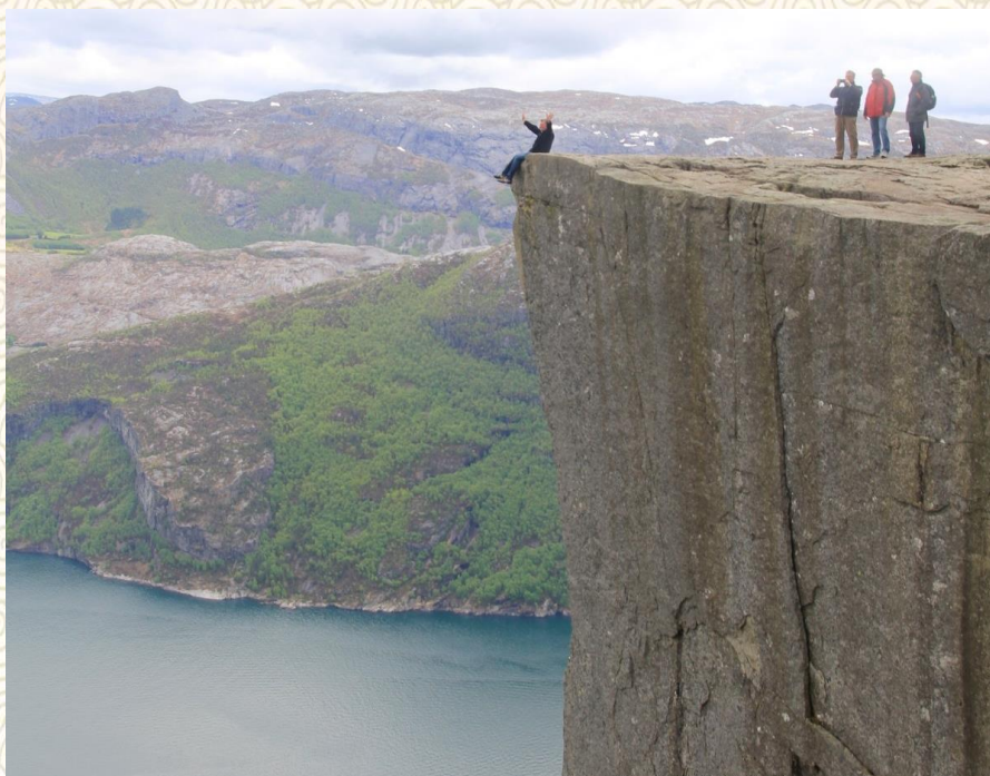
无比壮阔的吕瑟峡湾

生活是一个充满精彩的大舞台，用镜头捕捉生活的细节，异国的风情与独特，文化的冲击与交融，生动的画面，足以让一切的一切，尽在不言中。镜头下，海外交流中一个又一个扣人心弦的瞬间，一段又一段回忆，定格为永恒。