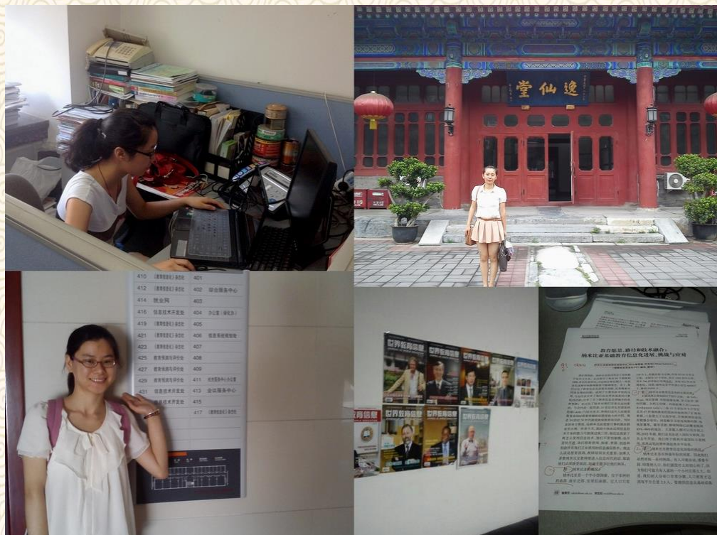
服务国家教育决策信息调研： 在教育部《世界教育信息》杂志编辑部实习

教育学院本科生和研究生暑期赴北京多所高校和教育部相关机构开展为期 20 天左右的实习实践活动。通过岗位实习、项目支持、人物访谈、讲座交流等多样化形式，鼓励大学生关注与研究国际教育发展趋势和国家教育战略动向，开阔教育服务与领导视野，增强专业成长与职业发展的潜能。