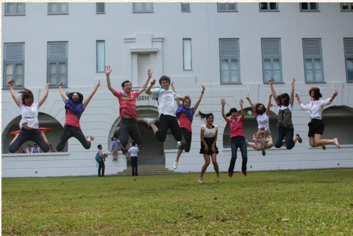
欢跃在新加坡国立大学