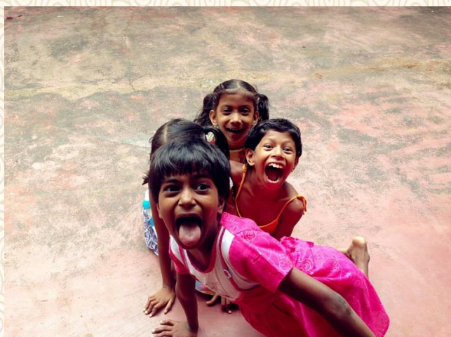
当孩子们看到我来了