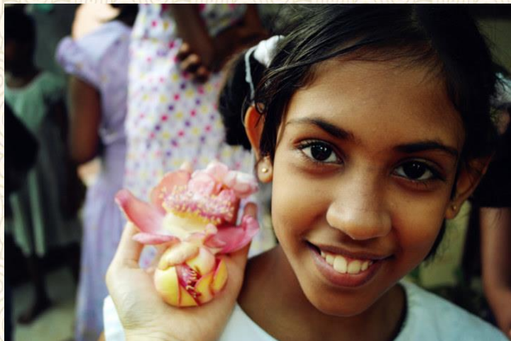
斯里兰卡儿童发自内心的笑