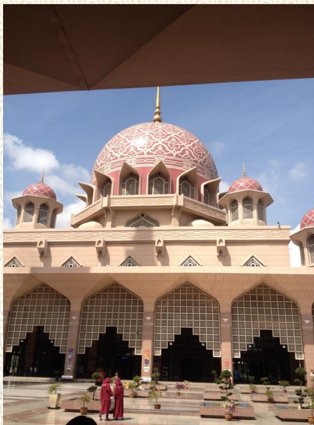
马来西亚-布城-伊斯兰教建筑全观