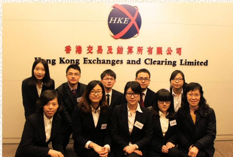
参访 HKE 公司

香港，是一座特别的城市，在这里，我体验到了同一个国度里的别样风情。学习交流之余，访问 FWD、HKE 等公司，游览维多利亚港湾……都为这一次的唐大威交流之行，增添了诸多趣味和精彩！